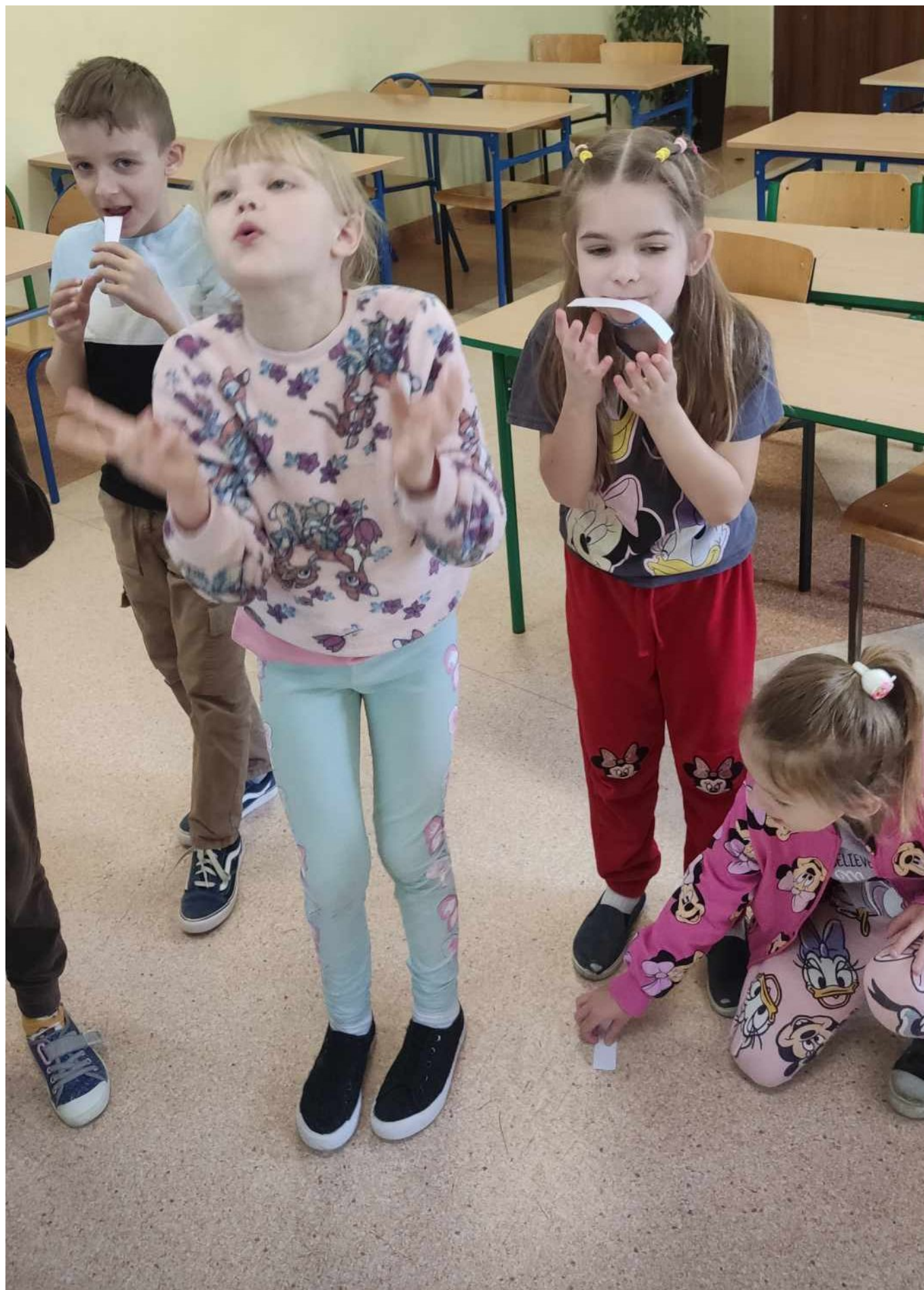
Szkoła Podstawowa im. Jana Pawła II w Starych Kobiątkach realizuje Projekt pt. "Wsparcie dostępu