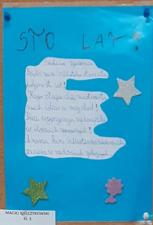
MACIEJ ŚCIEŻKOWSKI KL. 5