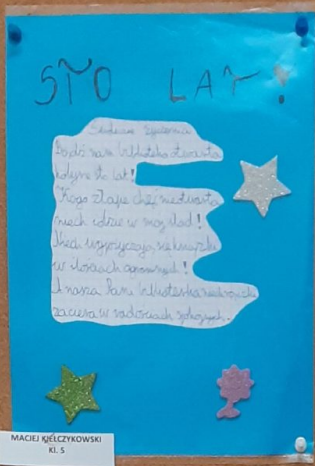
MACIEJ ŚCIEŻKOWSKI KL. 5